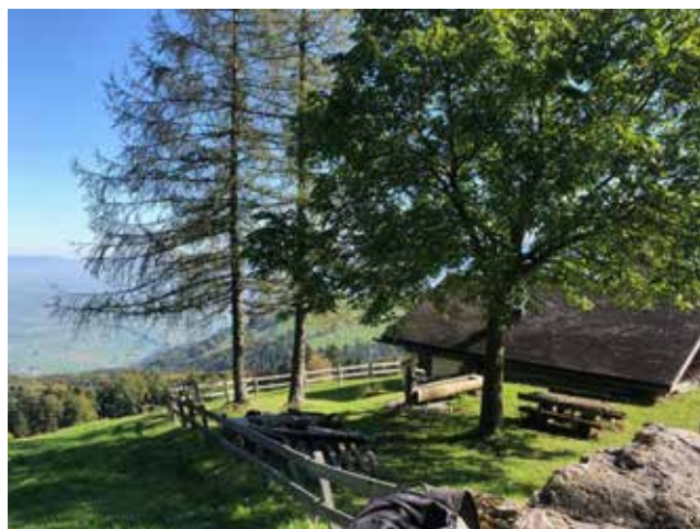
Alphütte Oberer Strüssler – Alpöhi mässig.