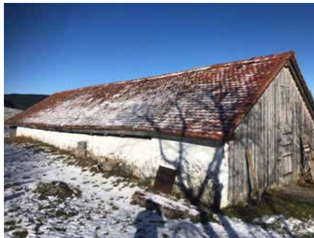
Alpstall auf der Wogalp mit erheblichem Renovationsbedarf (Dach, WC). Und kann für die Tierhaltung leider nicht mehr sinnvoll nutzbar gemacht werden

Erste Baupläne und eine grobe Kostenschätzung liegen vor. Die Kosten belaufen sich auf rund CHF 230'000. Wir sind bereits mit der Landwirtschaftlichen Kreditkasse in regem Kontakt, um die Kantons- und Bundesbeiträge abzuklären. Die maximalen Beiträge dürften gemäss heutigem Wissenstand bei rund CHF 30'000 liegen. Dies bedeutet, dass wir die restlichen CHF 200'000 aus den Eigenmitteln finanzieren müssten.