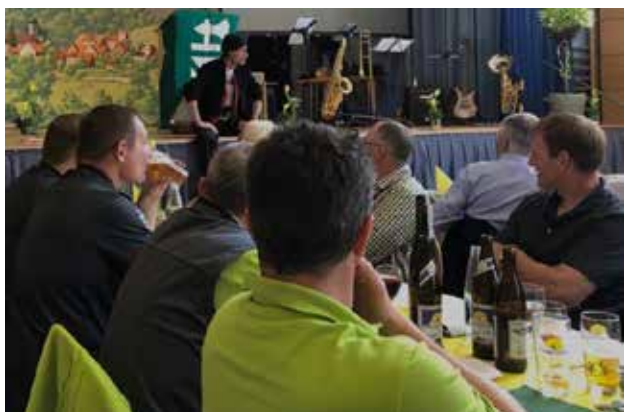
Beim Nachmittagsprogramm war viel Gemütlichkeit angesagt.