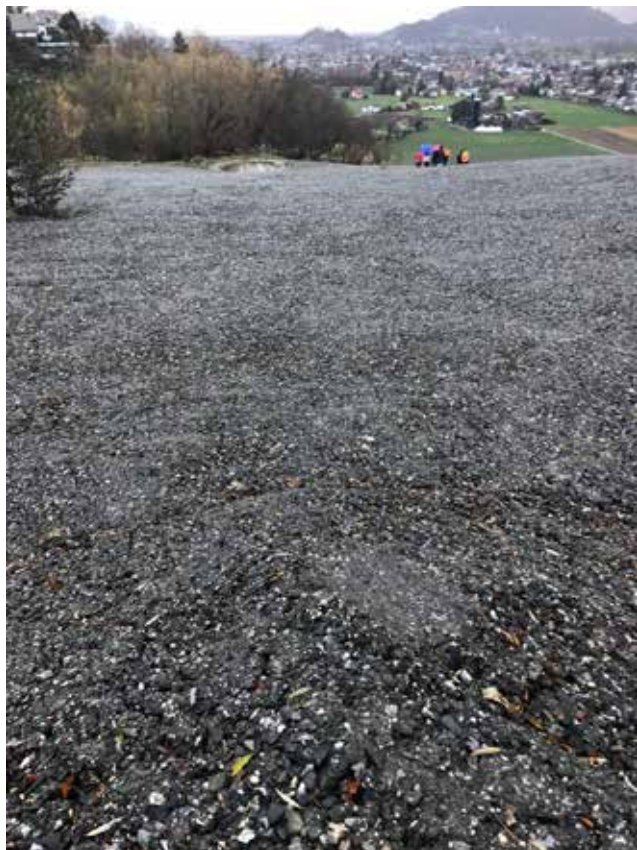
Die Nordseite der Deponie ist praktisch abgeschlossen und soll den Oberrietner schon bald als FIS-Slalomhang dienen☺.