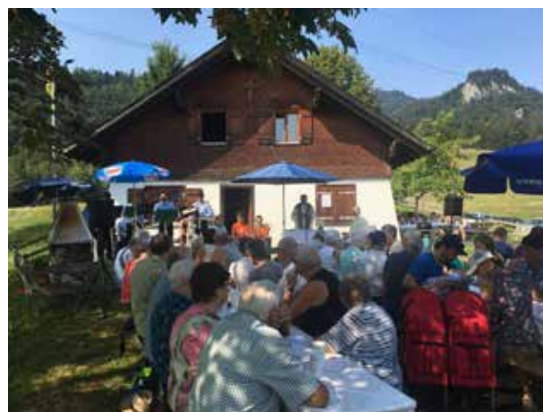
Sehr gut besuchte Messe auf der Wogalp.

Am 5. August fanden sich rund 140 Kirchbürger zum Alpgottesdienst auf der Wogalp ein. Die Anwesenden schätzten die etwas tieferen Temperaturen auf der Höhe von 882 Meter.