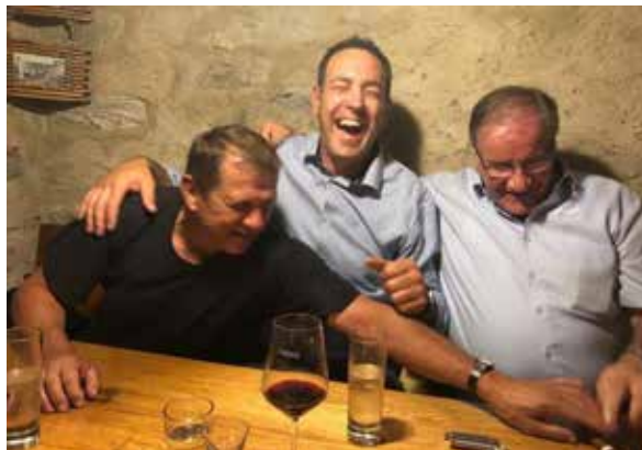
Am Abend scheinen diese aber verfliegen zu sein...