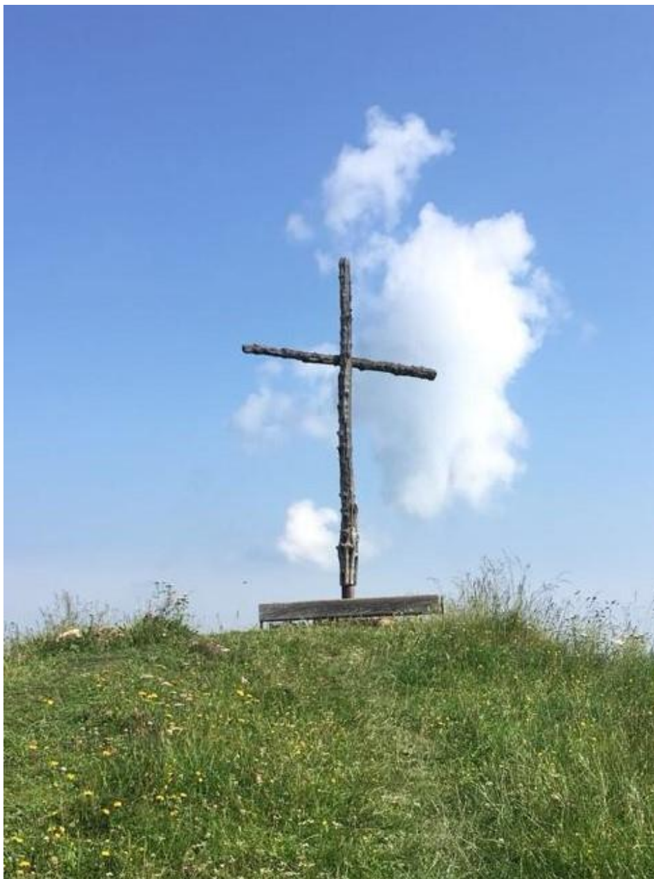
Fähneraspitze 1505 m (Sommer 2018)