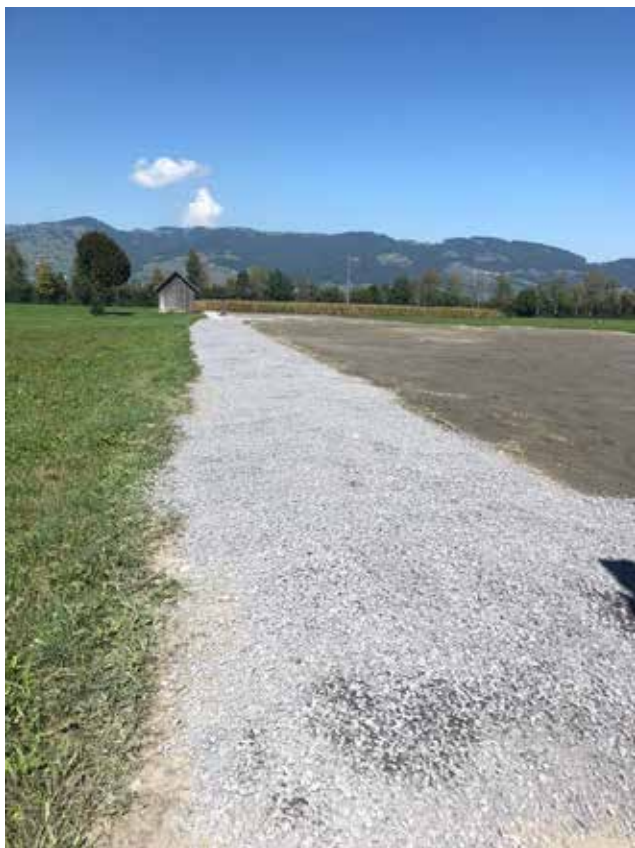
Erschliessungsstrasse mit gelungener Aufschüttung oder was kann hier vom Grundsatz her denn nur so verkehrt sein!?

Ein weiteres Projekt haben wir im Köcher, welches wir so aber nicht ganz freiwillig angingen... Doch der Reihe nach. Bei einer bewilligten Aufschüttung im Eisenriet erhielten wir von der Politischen Gemeinde einen Baustopp verfügt. Die Begründung: es wurde ein Mehrfaches der bewilligten Aufschüttung (100 m 3 ) vorgenommen. Bei einem Augenschein vor Ort konnten wir feststellen, dass die Aufschüttung fachmännisch und mit sehr gutem Material vorgenommen wurde. Dies zum Vorteil des Bodens. Allerdings wurde die bewilligte Aufschüttung von 100 m 3 deutlich überschritten.