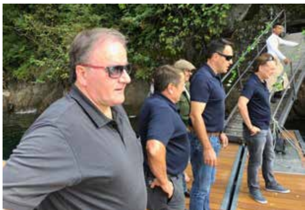
So viele skeptische Blicke. Was da wohl bevorstand?