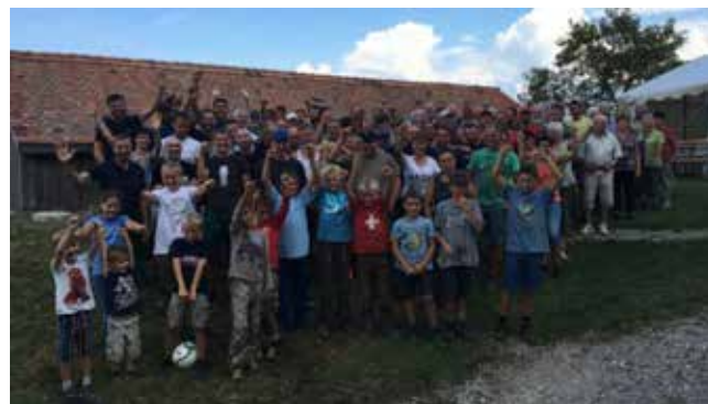
Mehr als 100 Helfer und Helferinnen stellten ihre Arbeitskraft zur Verfügung. DANKE.

Bei prächtigem Sommerwetter beteiligten sich beinahe 100 Helfer und Helferinnen am Gmoawearch. Viele Mäh-, Holzer- und Aufräumarbeiten wurden ausgeführt. Bei der Alp Loos wurde die Brunensäule ersetzt und einen Vorplatz erstellt. An der Steigstrasse, eine beliebte Wanderstrecke, wurde mit viel Mannes- und Maschinenkraft der Weg verbessert und weitere Regenrinnen angebracht