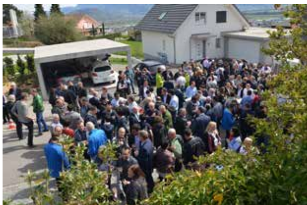
Nach dem offiziellen Teil wurde beim Apéro auch die flüssige Sonne genossen...☺