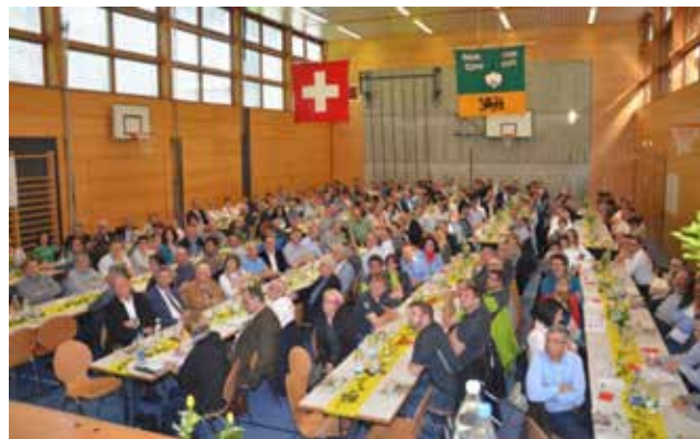
Ortsgemeindevertreter aus dem ganzen Kanton St. Gallen zu Gast in Kobelwald

Wir bedanken uns auch an dieser Stelle bei allen Helfer und Helferinnen für die tatkräftige und wertvolle Unterstützung.