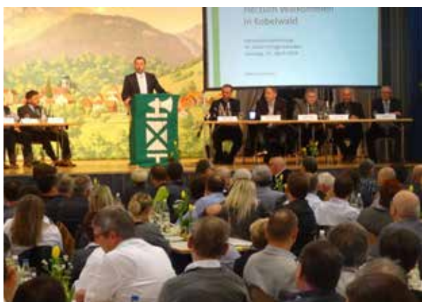
Der gutbesuchten GV wohnten über 200 Mitglieder bei.